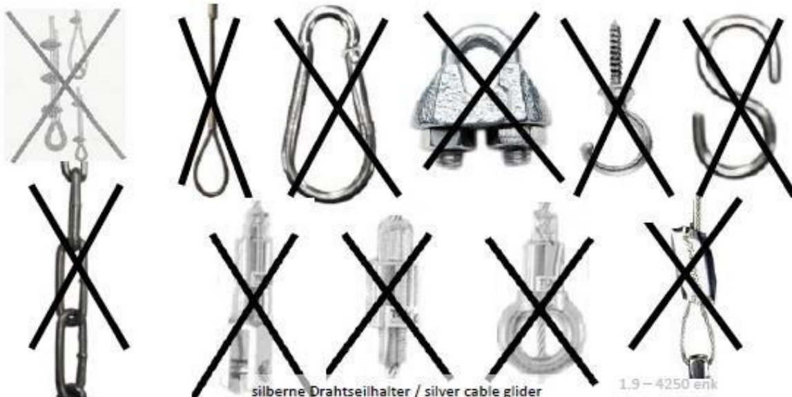
silberne Drahtseilhalter / silver cable glider